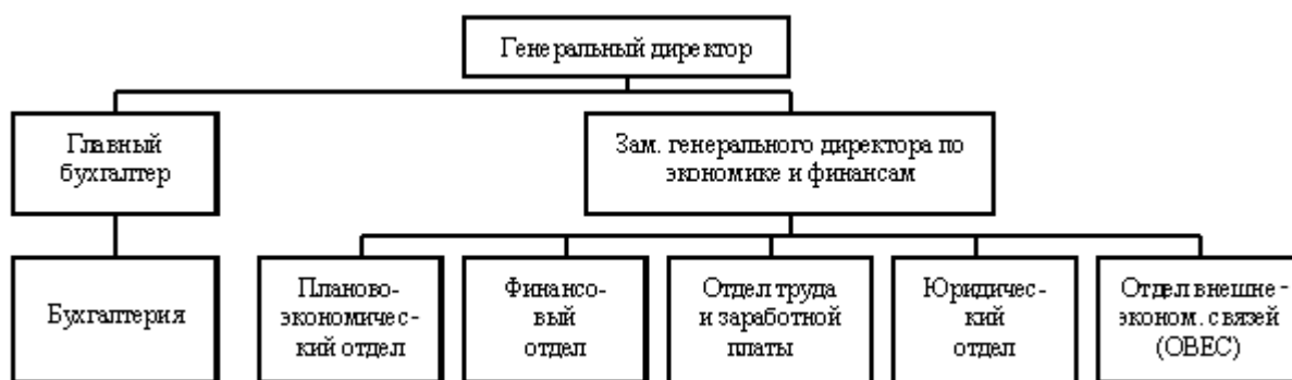
Рисунок 1 – Организационная структура предприятия

Например: при анализе организационной структуры предприятия может быть представлена ее схема (Рисунок 1).